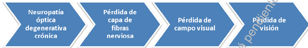
Figura 2. Esquema de la progresión del glaucoma

Los glaucomas se clasifican en primarios y secundarios. Los glaucomas primarios son aquellos en los que no se identifica una causa concreta. En los glaucomas secundarios se identifica una causa que puede ser una enfermedad (por ejemplo infección en los ojos) o como consecuencia de ciertos fármacos (por ejemplo los corticoides).