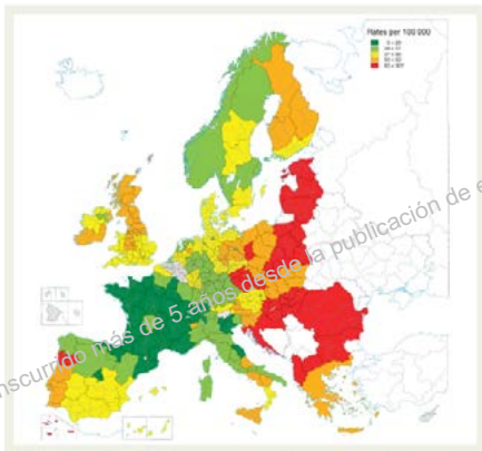
Hombres entre 45 y 74 años, año 2000