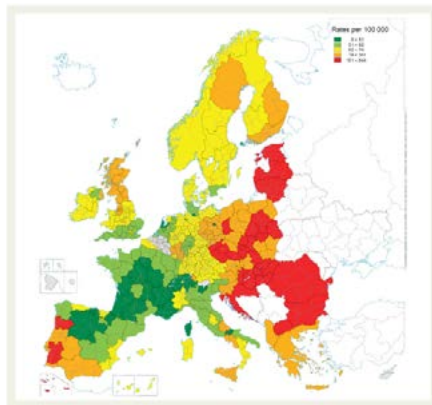
Figura 7. Tasas de mortalidad estandarizada por edad para enfermedad cerebrovascular en las regiones de Europa